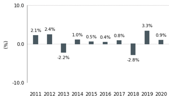
Diagramme en bâtons des rendements annuels (%)