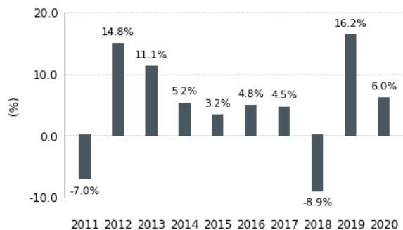
Diagramme en bâtons des rendements annuels (%)