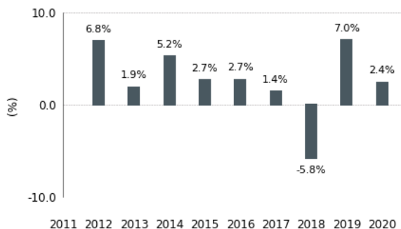
Diagramme en bâtons des rendements annuels (%)