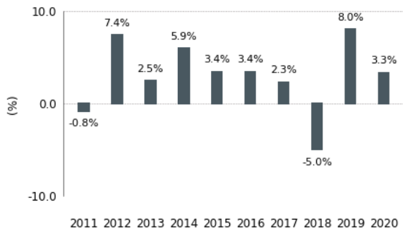
Diagramme en bâtons des rendements annuels (%)